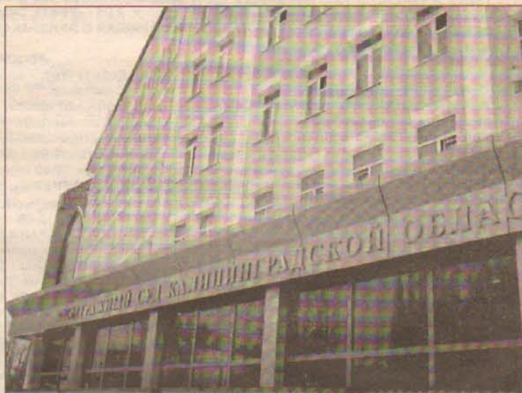
Арбитражный суд Калининградской области.

Кроме того, уже в процессе судебного рассмотрения распоряже-