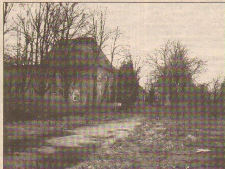
Земля военного городка № 8А.

Когда верстался номер, редакции флотской газеты стало известно, что ответчикам поступило заявление от мэрии Калининграда об уточнении требований по этому делу. Теперь городские власти просят арбитражный суд Калининградской области вовсе прекратить право собственности Российской Федерации на земельный участок площадью 2,24 га для размещения военного городка №8А в г. Калининграде по улице Демьяна Бедного.