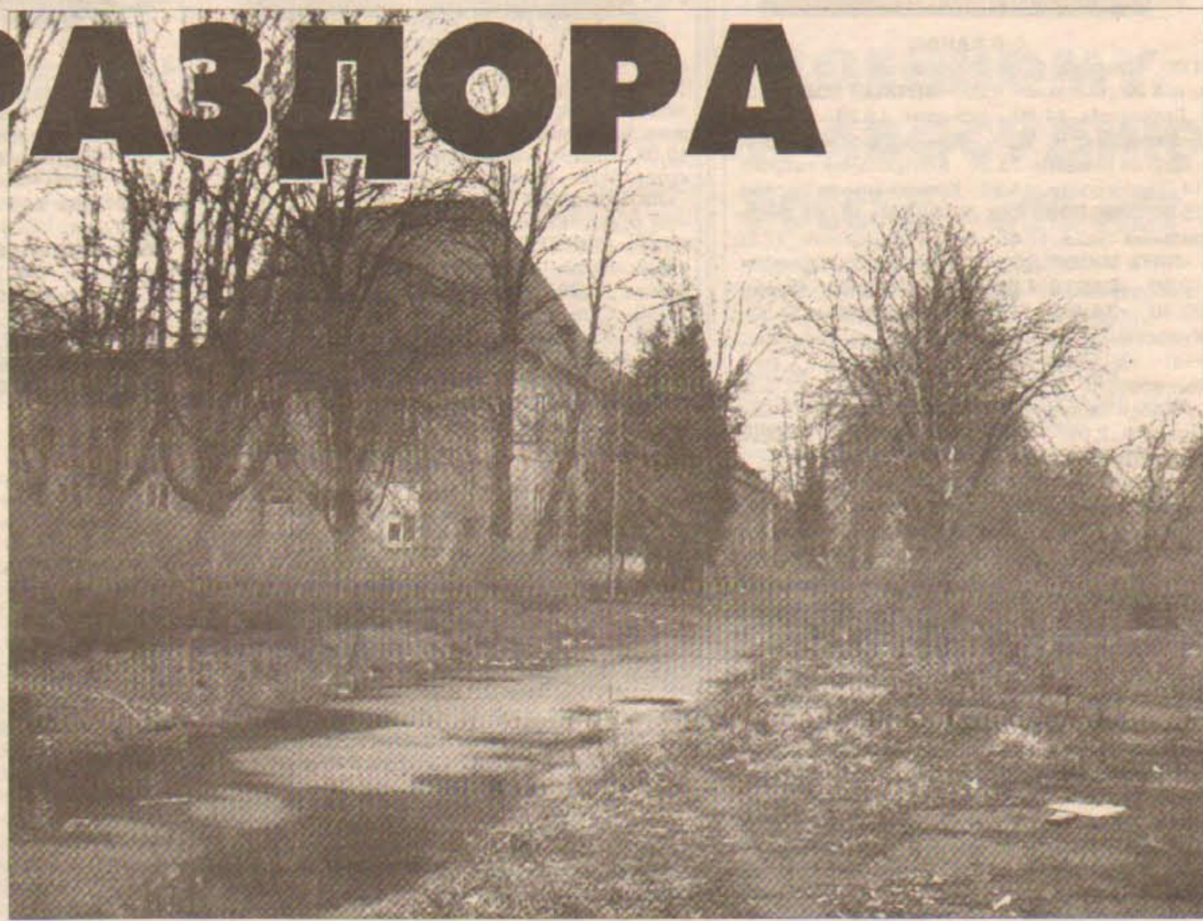
Предметом спора стала земля и объекты военного городка №8.

Начиная с ноября 2006 года мэрия Калининграда фактически противодействует реализации инвестиционного проекта по строительству многоквартирного дома, где планировалось расселить военных. И происходит это под благовидным предлогом защиты права беспрепятственного отдыха горожан в парке зеленых насаждений. Между тем городские власти не предпринимают никаких дей-